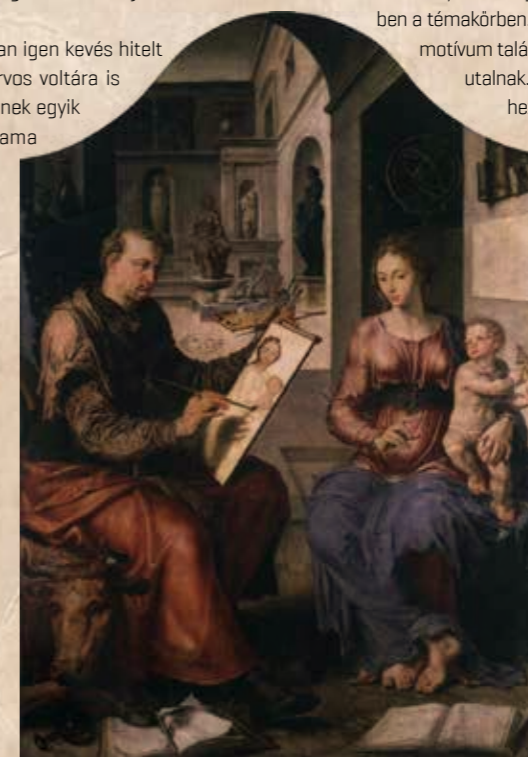
Maarten van Heemskerck: Szent Lukács a Madonnát festi. Musée des Beaux-Arts, Rennes