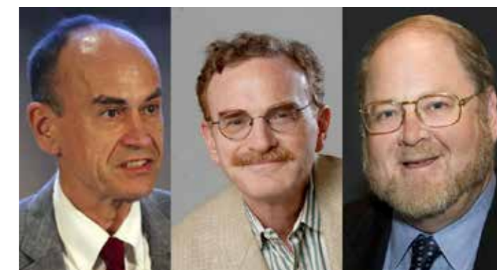
Thomas Südhof, Randy Schekman és James Rothman

A sejt szállítórendszerének szabályozásával kapcsolatos felfedezésekért az amerikai James Rothman és Randy Schekman, valamint a német Thomas Südhof kapta megosztva az idei orvosi-életlen Nobel-díjat.