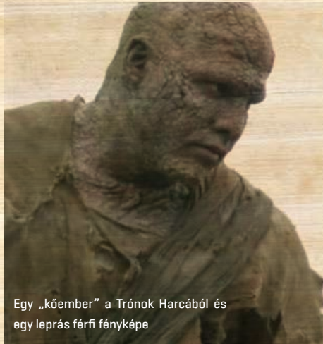
Egy „kőember” a Trónok Harcából és egy leprás férfi fényképe

A bőrt elszínező és érzéketlenné tévő, gyakran csonkuláshoz is vezető betegségről tudjuk, hogy már az ókorban is létezett, sőt már az Őszövétség is tartalmaz utasításokat arra vonatkozólag, hogyan kell bánni a leprásokkal – igaz, számos kutató vitatja, hogy az adott szöveghelyen valóban az általunk ismert betegségről van szó. Igazi „hírnevet” a kereszties hadjáratok után szerzett magának a fertőzés, amikor a korábnál sokkal erő-