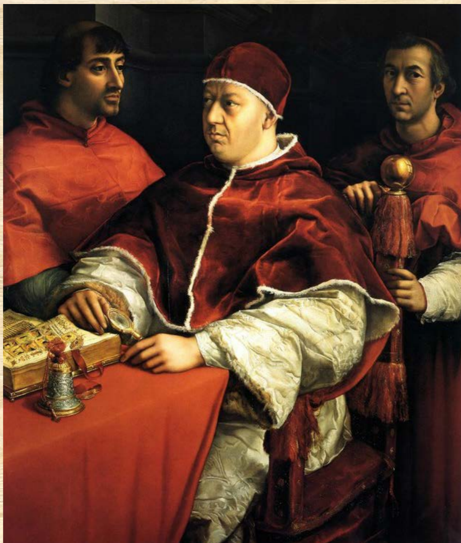
X. Leó pápa korai szemüvegével

Ákármi is az oka a terjedésnek, annyi bizonyos, hogy a régi időkben jóval kevesebb embert érintett a miopia, mint napjainkban. A rövidlátók számára készült lencsék késői megjelenése arra utal, hogy a kevés számú miópiában szenvedő egyén kezelése régen nem volt prioritás. Az emberek vélhetően al-