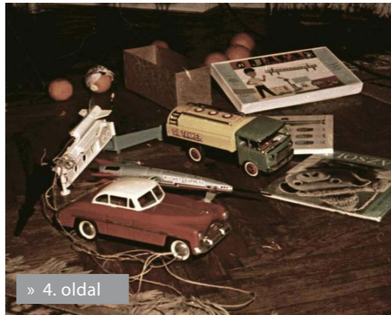
» 4. oldal