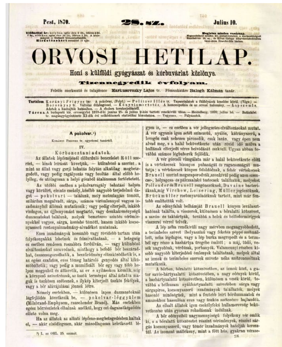
Korányi Frigyes tudományos írása

felfigyelt, meghatározó kézikönyvek (lépfenéről, tüdőbetegségekről szóló) fejezeteit írta meg.