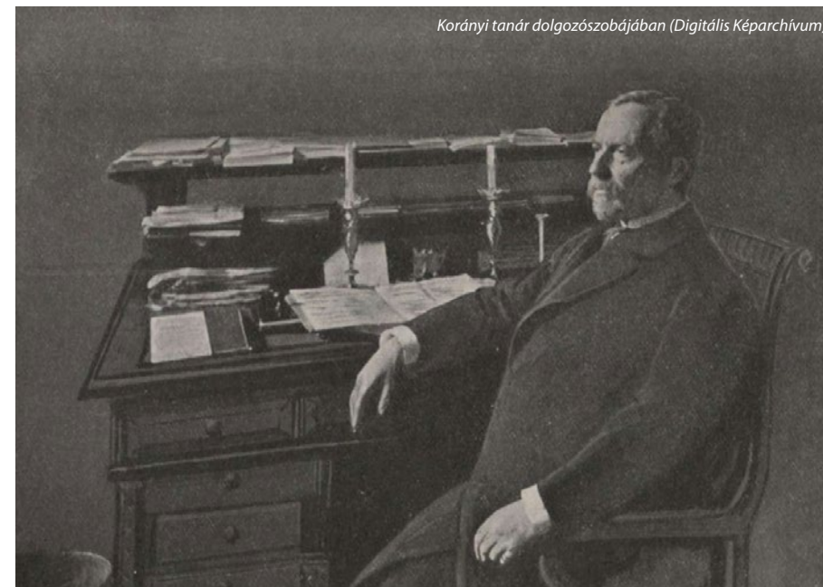
Korányi tanár dolgozószobájában

Korányi részt vett az egészségügyi reformintézkedések kidolgozásában, bevezette a laboratóriumi kutatást, a biokémiai, a bakteriológiai és a röntgenvizsgálatokat, a klinikai gyakornoki rendszert. Az első magyar orvos volt, akinek tudományos munkásságára a külföld is